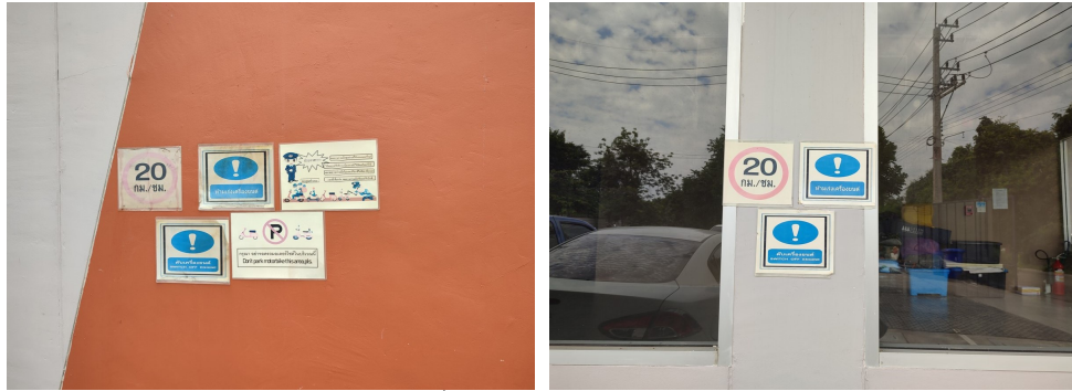
ภาพที่ 4-3 ป้ายจำกัดความเร็วรถ