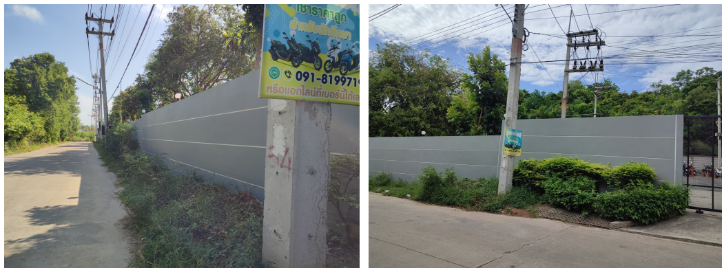
ภาพที่ 4-1 รั้วกันขอบเขตพื้นที่โครงการ