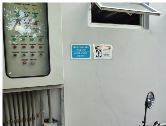
ภาพที่ 4-9 ป้ายบอกบริเวณบ่อน้ำบำบัดน้ำเสีย