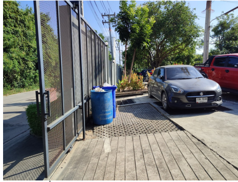
ภาพที่ 4-22 ถังรองรับมูลฝอยภายในโครงการ