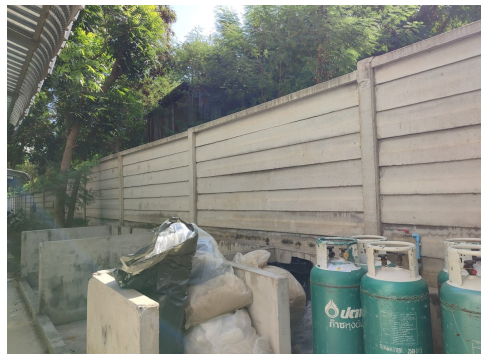
ภาพที่ 4-11 ที่พักมูลฝอยรวมของโครงการ และการคัดแยกมูลฝอย