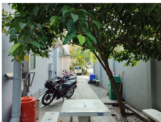
ภาพที่ 4-2 พื้นที่สีเขียว ของโครงการ