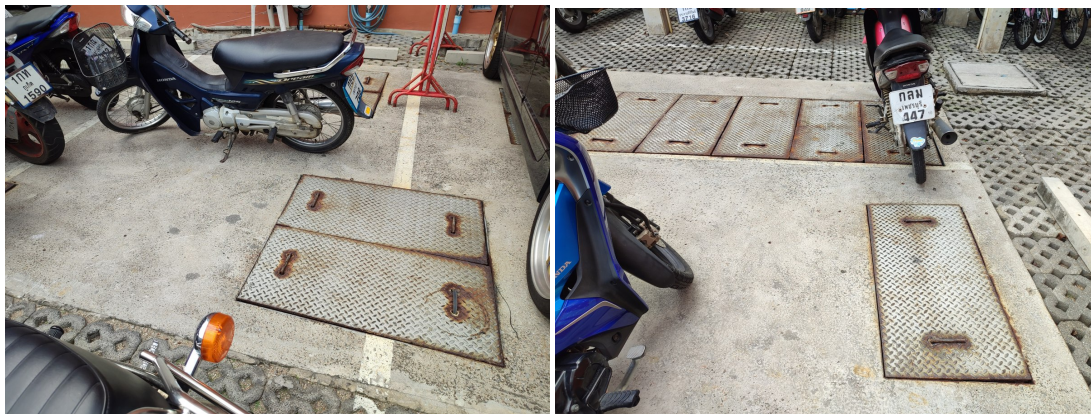
ภาพที่ 4-8 พื้นที่บำบัดน้ำเสีย