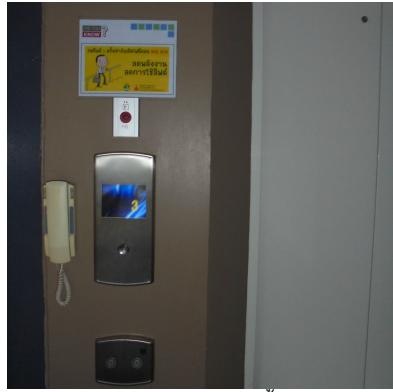
ภาพที่ 4-14 บ้ายรณรงค์ให้ใช้การเดินขึ้น-ลงแทนการใช้ลิฟต์