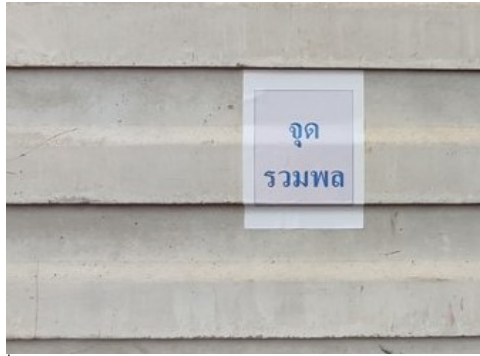
ภาพที่ 4-18 บ้ายจุดรวมพลของโครงการ มีการชำรุดรกรอกซ่อมแซม