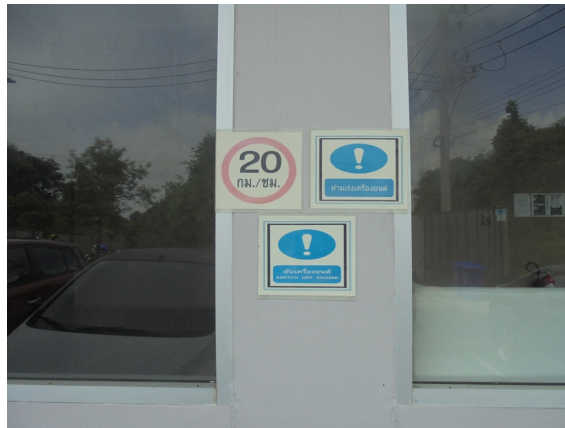
ภาพที่ 4-7 ป้ายห้ามเร่งเครื่องยนต์