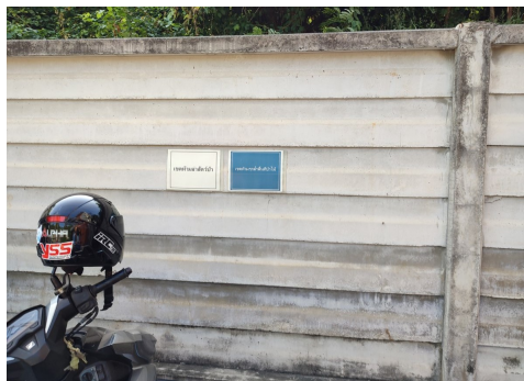
ภาพที่ 4-12 ป้ายห้ามล่าสัตว์ป่า และห้ามรุกรานพื้นที่ป่า