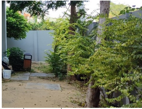
ภาพที่ 4-10 บริเวณที่กำลังกำจัดมีเทนและแอมโมเนีย