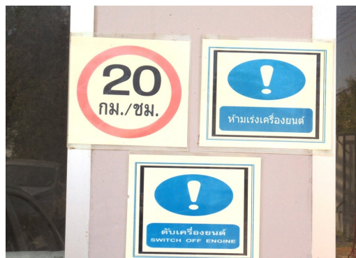
ภาพที่ 4-5 ป้ายห้ามติดเครื่องยนต์ทิ้งไว้