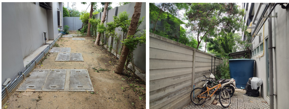
ภาพที่ 4-24 ฝาบ่อบำบัดน้ำเสีย ปิดสนิท ถังสำรองน้ำใช้มีสภาพดี