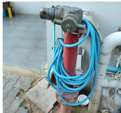
ภาพที่ 4-16 หัวรับน้ำดับเพลิงจากภายนอก