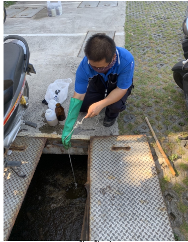
เก็บตัวอย่างน้ำทิ้งที่บ่อปรับสมดุล