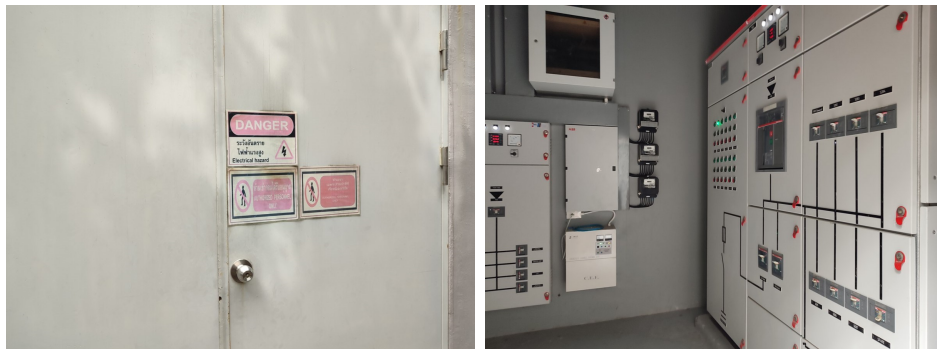
ภาพที่ 4-23 ห้องไฟฟ้าปกติและป้ายเตือนอันตราย