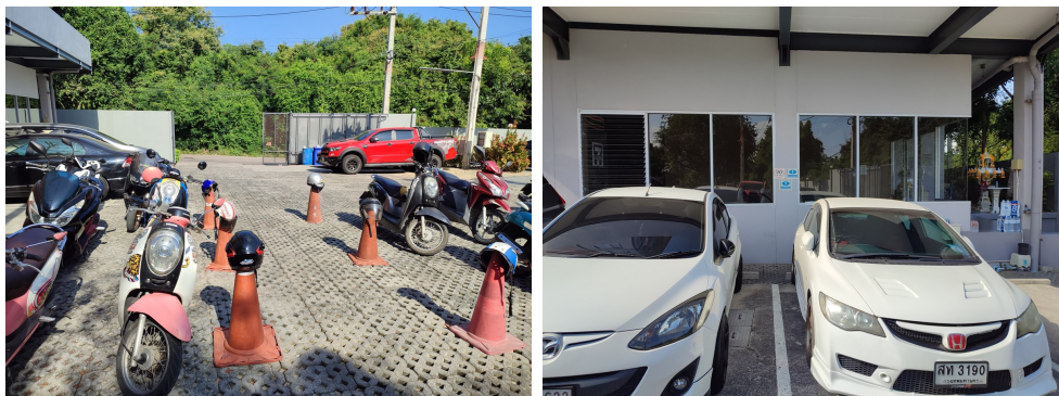
ภาพที่ 4-4 ที่จอดรถยนต์ และรถจักรยานยนต์