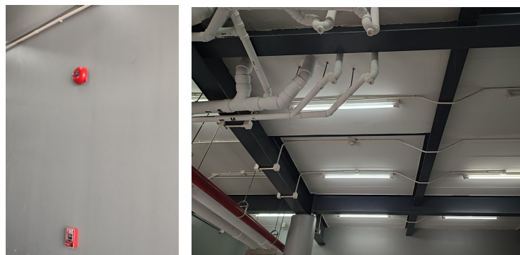
ภาพที่ 4-17 ระบบเตือนอัคคีภัย