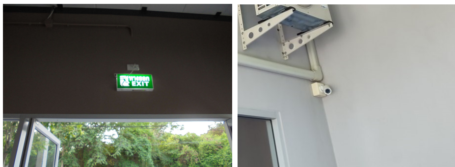
ภาพที่ 4-21 บ้ายทางหนีไฟ และภาพที่ 4-22 กล้องวงจรปิดภายในอาคาร