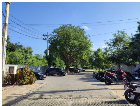
ภาพที่ 4-6 พื้นทางวิ่งรถเป็นบล็อกหญ้าและพื้นคอนกรีต ไม่มีฝุ่นละอองฟุ้งกระจาย