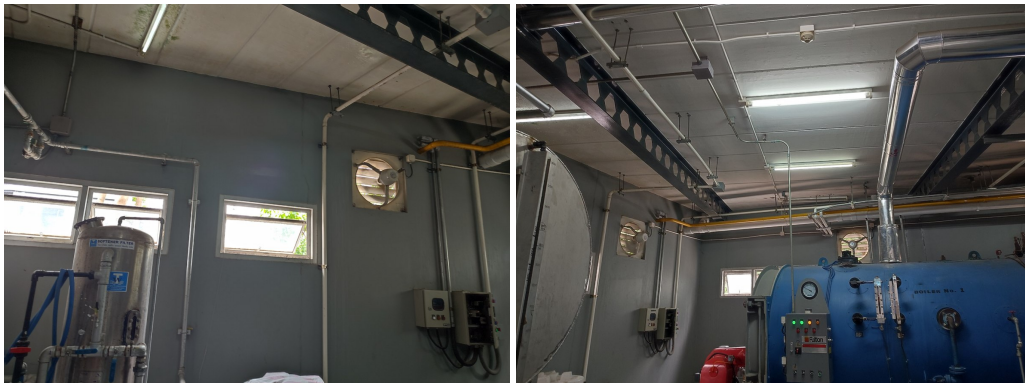
ภาพที่ 4-19 ช่องเปิดระบายอากาศของอาคาร และพัดลมระบายอากาศ และระบบเตือนอัคคีภัย