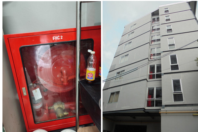
ภาพที่ 4-15 ระบบท่อเย็นและตู้เก็บสายฉีดน้ำดับเพลิงพร้อมอุปกรณ์