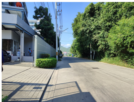
ภาพที่ 4-25 ทางเข้าออกโครงการไม่มีรถจอดกีดขวาง